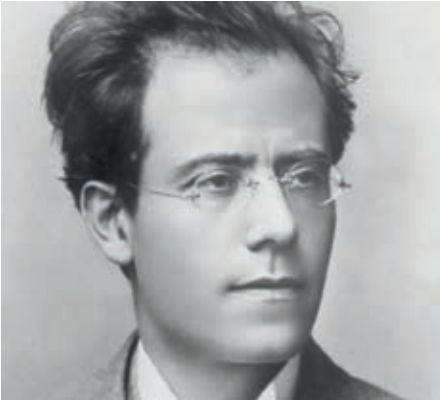
Mahler während seiner Studienzeit in Wien. Eigenhändige Niederschrift des Quartettsatzes von Gustav Mahler