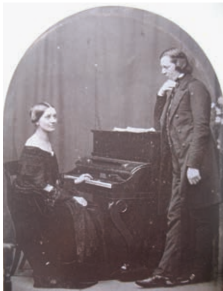
Clara und Robert Schumann in einer Daguerrotypie von 1850