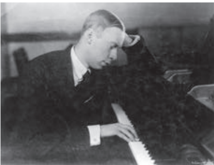
Der junge Prokofjew

brauchte, zurück nach Moskau. So wie er sich in Paris voller Eifer in die Ballettkomposition stürzte, so setzte er in Moskau nun seine ganze Kraft für das neu entstandene Genre der Filmmusik und für die in Russland sehr beliebten Ballette und Theatermusiken ein. Die Musik zu «Lieutenant Kije» ist wohl das bekannteste Beispiel seiner Filmmusiken und «Romeo und Julia» sein berühmtestes Ballett aus dieser Zeit. Mit der Rückkehr in die Heimat streifte der Komponist seinen oft bärbeissigen Humor und seinen Hang zum Grotesken in der Musik ab und fand neue, sehr lyrische und elegische Töne. Die Kriegsjahre stimmten den älter werdenden Komponisten milder, sein Hang zu grober Rhythmik verschwindet, seine lyrischen Melodien werden zarter und ausgespinnener, und erstmals findet auch russisches Volksmelodiegut Eingang in seine Kompositionen. Die Cellosonate C-Dur , wenige Jahre vor seinem Tod in Moskau geschrieben, ist wohl das typischste Beispiel für diesen Spätstil, der immer noch an den übermütigen, sarkastischen Komponisten der 20er und 30er Jahre erinnert, aber auch ganz neue und ungewohnte Momente enthält.