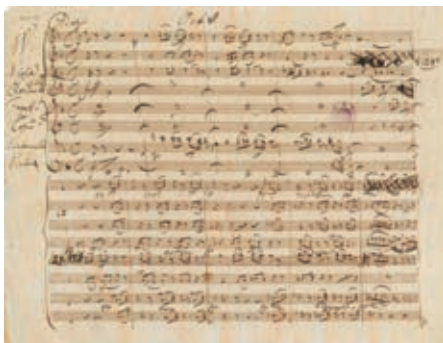
Schubert, Oktett. Eigenhändiges Manuskript

Kleinmeister in Hülle und Fülle boten. Sich hingegen auf Schuberts Längen einlassen wollte man nicht. Erst mehr als 30 Jahre nach Schuberts Tod brachte eine legendäre Aufführung mit dem Geiger Joseph Hellmesberger das Werk zurück ins musikalische Gedächtnis der Interpreten und des Konzertpublikums. So darf man sich nicht wundern, warum Schubert sich in seinen Briefen sehr oft desillusioniert und enttäuscht zeigt, häufig auf seine finanziell schwache Position hinweist und sich oft kaum trösten lässt, auch wenn er im Freundeskreis als Liederkomponist hoch verehrt wird.