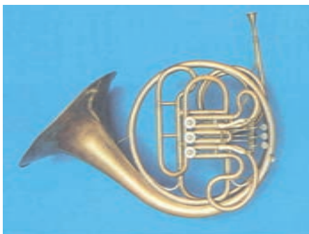
Waldhorn mit drei Ventilen um 1850